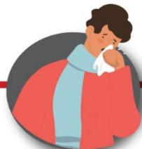
Después de toser o estornudar