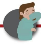
Cubre boca y nariz al toser o estornudar usando la parte interior del codo o con un pañuelo desechable