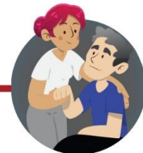
Cuando cuides enfermos